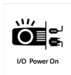
I/O Power On

Mit der HDMI Power On Funktion ist der Projektor in der Lage sich automatisch einzuschalten, sobald der Projektor ein Signal per HDMI oder VGA zugespielt bekommt. Sie brauchen den Projektor nicht mehr separat zu starten, sondern können einfach ihr Notebook, ihren Receiver oder die Spielekonsole einschalten und der Projektor schaltet sich automatisch ebenfalls ein.